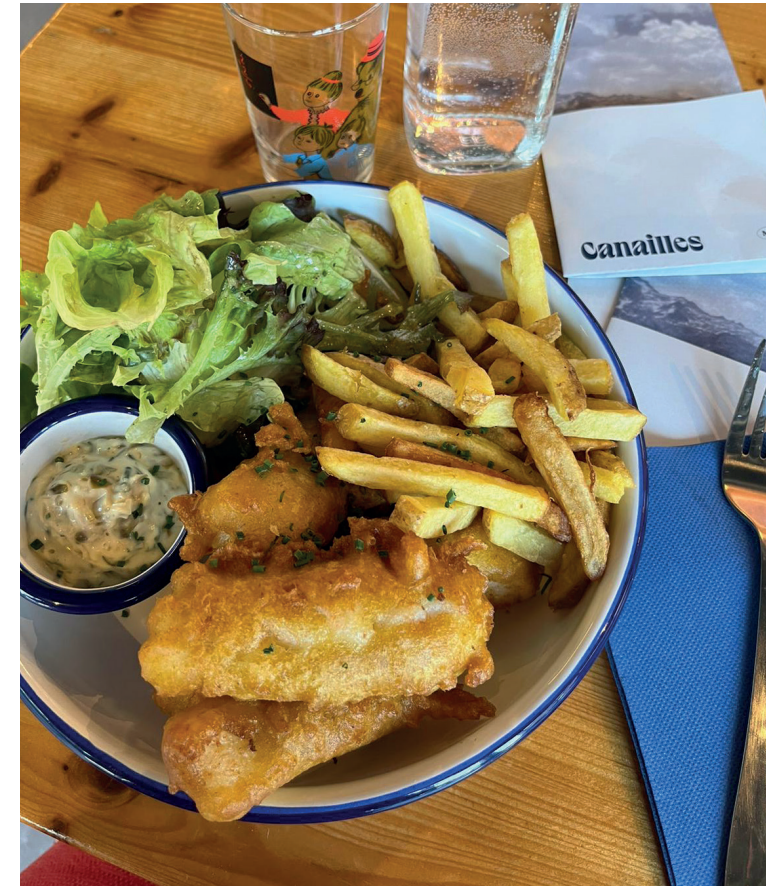
CANAILLES STREET FOOD _Street food, good food. Déjà présents à Annecy, les Canailles importent leur amour du bon et du local aux Nouvelles Galeries. Au menu, une street food premium de saison, préparée sur place à partir de produits bruts issus de circuits courts et de producteurs du coin. Des burgers au sommet, mais pas que, les pulled pork, fish and chips, frites, salades et autres onion rings maison méritant aussi largement le détour par la salle d'escalade Atome où les Canailles se sont établis.