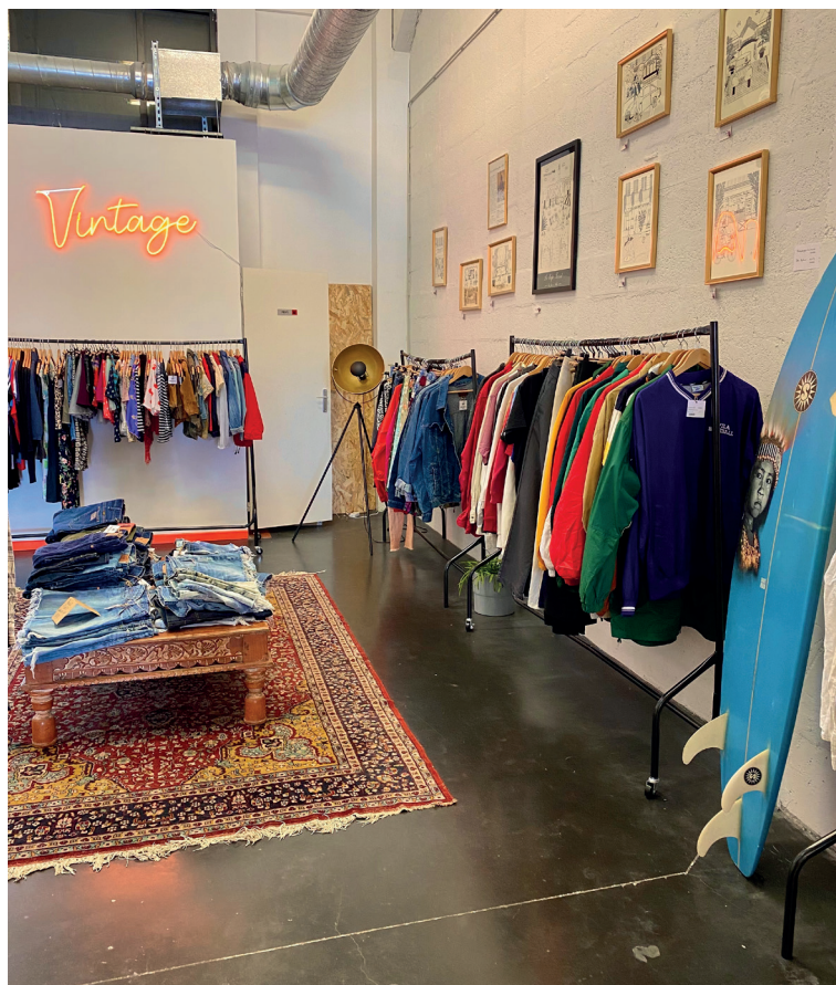
CONCRETE RAW _Brut de cool. L'utile agréable, c'est bien. L'utile agréable, engagé et durable, c'est bien mieux, et c'est la raison d'être de Concrete Raw. Au gré de la promenade, on déniché au cœur de son corner créateurs des vêtements, cosmétiques, déco et accessoires localissimes ; on écoute les pépites de sa friperie 80' ; on s'éprend des marques alchimistes qui transforment rebuts des champs et des océans en chaussures, lunettes et autres maillots seyants. Chez CR, même les murs sont stylés, signés par les artistes qui inspirent la maison et dont on peut s'offrir les œuvres. Mieux consommer n'a jamais été aussi concret.