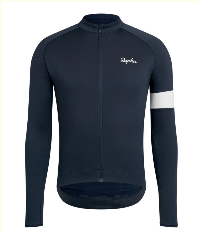
Rapha Core Long Sleeve Jersey Dark navy _105€