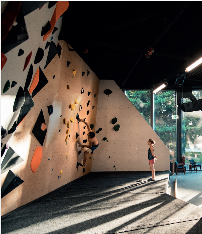
ATOME _Sommet d'hybridité. Imaginé par une communauté de passionnés de grimpe, ATOME combine salle d'escalade et espace de restauration. Premier de cordée du centre-ville, l'endroit met à la disposition de tous un bloc, un mur connecté et un espace enfants. Grimpeurs, sportifs et familles se retrouvent autour de la streetfood premium servie en continu par les Canailles, et d'évènements réguliers.