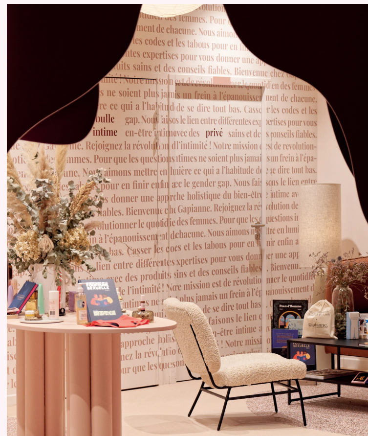
GAPIANNE _Annéciennes, je vous aime. Première boutique locale entièrement conçue autour de leur bien-être intime, Gapienne propose aux femmes une sélection de soins naturels et de produits self-care de qualité. Persuadée que l'information est la clef de l'épanouissement, la boutique met également à leur disposition des conseils personnalisés, des guides thématiques et organise régulièrement des masterclass.