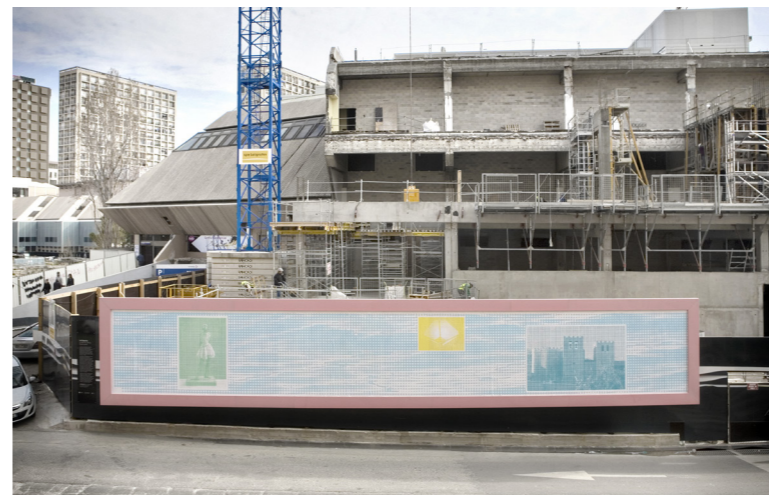
Loïc Raguénès, Le Salon de l'affiche, Mademoiselle , 2013 Œuvre commandée et produite par Citynove pour les Galeries Lafayette

La commande artistique à Pieter Vermeersch pour les Galeries Lafayette de Biarritz illustre l'engagement de l'entreprise pour provoquer la rencontre entre l'art contemporain et le public. Fondé il y a près de 120 ans, le groupe Galeries Lafayette place la création au cœur de sa vocation et défend l'accessibilité à l'art dans ses vitrines et ses magasins.